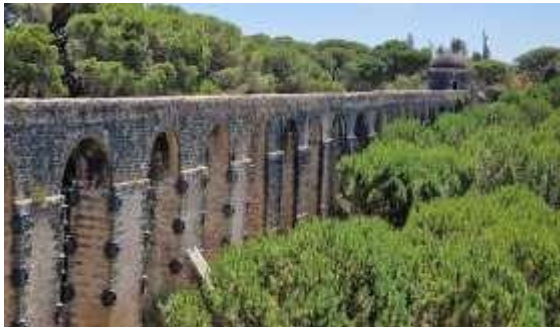
Aqueduc de Pegoes